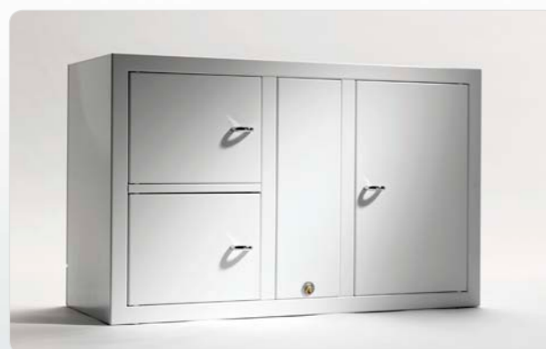
7002 E Anbauschränk der Expansion-Serie mit 2 Aufbewahrungsfächern. Außenmaße: 745x460x270 Gewicht: 20 kg