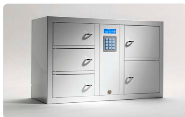
7002 S Aufbewahrungsschrank mit 2 Aufbewahrungsfächern. Außenmaße: 745x460x270 Gewicht: 20 kg