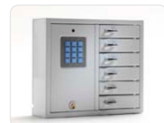
9006 B Schlüsselschrank der Basic-Serie mit 6 kleineren Fächern. Außenmaße: 350x280x85 Gewicht: 5,3 kg