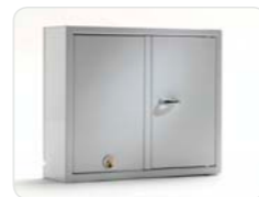
9001 E Anbauschränk der Expansion-Serie mit 1 Tür und 29 Schlüsselhaken. Außenmaße: 350x280x85 Gewicht: 4,3 kg