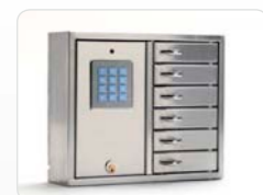
9006 B Stainless Rostfreier Schlüsselschrank der Basic-Serie mit 6 kleineren Fächern. Außenmaße: 350x280x85 Gewicht: 5,3 kg