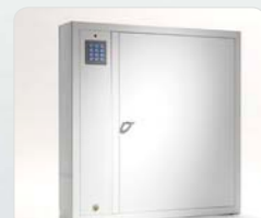
9500 B Schlüsselschrank der Basic-Serie mit 1 Tür und 216 Schlüsselhaken. Außenmaße: 746x730x140 Gewicht: 27 kg