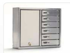
9006 E Stainless Rostfreier Anbauschränk der Expansion-Serie mit 6 kleineren Fächern. Außenmaße: 350x280x85 Gewicht: 4,3 kg