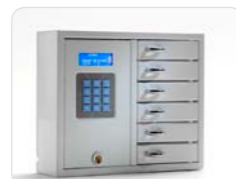
9006 S Schlüsselschrank der System-Serie mit 6 kleineren Fächern. Außenmaße: 350x280x85 Gewicht: 6,0 kg