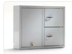
9002 E Anbauschränk der Expansion-Serie mit 2 Türen und 16 Schlüsselhaken (8 Schlüsselhaken je Tür). Außenmaße: 350x280x85 Gewicht: 4,3 kg