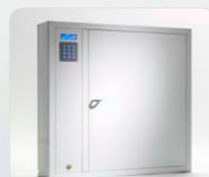
9500 S Schlüsselschrank der System-Serie mit 1 Tür und 216 Schlüsselhaken. Außenmaße: 746x730x140 Gewicht: 28 kg