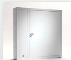
9500 E Anbauschränk der Expansion-Serie mit 1 Tür und 216 Schlüsselhaken. Außenmaße: 746x730x140 Gewicht: 27 kg