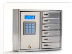
9006 S Stainless Rostfreier Schlüsselschrank der System-Serie mit 6 kleineren Fächern. Außenmaße: 350x280x85 Gewicht: 6,0 kg