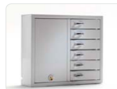
9006 E Anbauschränk der Expansion-Serie mit 6 kleineren Fächern. Außenmaße: 350x280x85 Gewicht: 4,3 kg