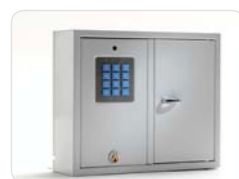
9001 B Schlüsselschrank der Basic-Serie mit 1 Tür und 29 Schlüsselhaken. Außenmaße: 350x280x85 Gewicht: 5,3 kg