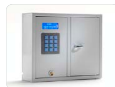
9001 S Schlüsselschrank der System-Serie mit 1 Tür und 29 Schlüsselhaken. Außenmaße: 350x280x85 Gewicht: 6,0 kg