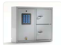
9002 B Schlüsselschrank der Basic-Serie mit 2 Türen und 16 Schlüsselhaken (8 Schlüsselhaken je Tür). Außenmaße: 350x280x85 Gewicht: 5,3 kg