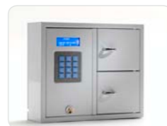
9002 S Schlüsselschrank der System-Serie mit 2 Türen und 16 Schlüsselhaken (8 Schlüsselhaken je Tür). Außenmaße: 350x280x85 Gewicht: 6,0 kg